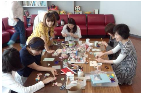
ママのリフレッシュタイムの様子